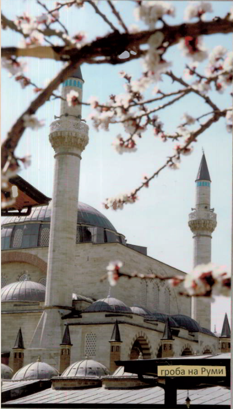
гроба на Руми