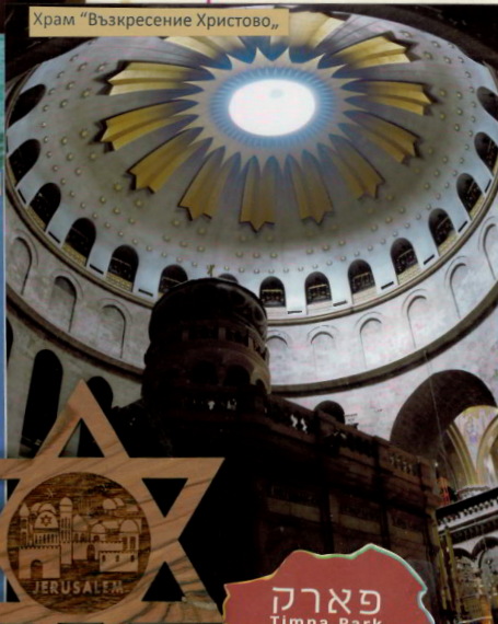
Храм "Възкресение Христово,"